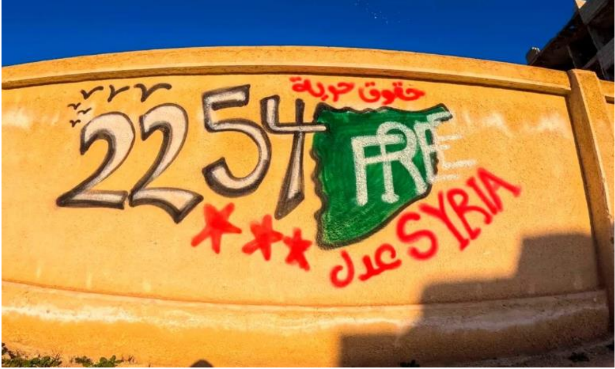
Şekil 2. BMGK'nın 2254 sayılı kararı yeniden gündemde (Anonim, 2024)

Viyana Zirvesi, 2015 Ekim ve Kasım aylarında, Suriye krizine çözüm bulmak amacıyla BM himayesinde ve ABD ile Rusya'nın ortak liderliğinde gerçekleştirilmiştir. Türkiye, İran, Suudi Arabistan, ABD, Rusya, Avrupa Birliği ve Arap Birliği gibi aktörlerin katıldığı zirvede, Suriye'de altı ay içinde bir geçiş hükümeti kurulması ve 18 ay içinde seçim yapılması hedeflenmiştir (Marcus, 2015). Terörle mücadelenin sürdürülmesi kararlaştırılırken, Beşar Esad'ın rolü en tartışmalı konu olmuştur. Rusya ve İran, Esad'ın geçiş sürecinde yer almasını desteklerken, Batılı ülkeler ve Türkiye karşı çıkmıştır. BM'nin müzakerelerde kolaylaştırıcı rolü üstlenmesi kabul edilmiştir. Zirve, uluslararası toplumun siyasi çözüme verdiği desteği gösterirken, BM Güvenlik Konseyi'nin 2254 sayılı kararı bu prensiplere dayanarak hazırlanmıştır (Euronews, 2015).