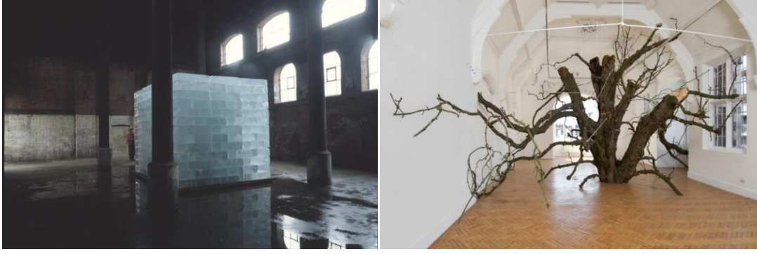
Görsel 5: Anya Gallacio, Yoğunluklar ve Yüzeyler / Intensities And Surfaces, Buz ve Kaya Tuzu, 1996.