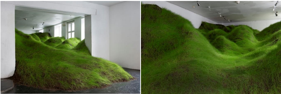
Görsel 1: Per Kristian Nygard, Kırmızı Değil Yeşil / Not Red But Green, No Place Galerisi, Çimen, Toprak ve Ahşap, Norveç, 2014.

Günümüzde hala sürmekte olan iklim değişikliği, okyanusların ısınması ve doğal dengenin bozulması gibi çevre sorunları üzerine çağdaş sanatçılar üretimlerde bulunmaya devam etmektedirler. Çalışmalarında doğal malzeme kullanarak insanlarda farkındalık yaratmaya çalışmaktadırlar. Bu sanatçılardan biri olan Per Kristian Nygard, toprak ve çimenleri sanat malzemesi olarak kullanmaktadır. Norveçli sanatçı, galerinin içerisinde çimenli tepelerden oluşan bir manzara oluşturmuştur. Duvardan duvara yayılmış, odanın sınırlarını taşımış olan bu manzara iç ve dış mekan arasındaki sınırları ortadan kaldırmaktadır. Not Red But Green isimli çalışmasını insanların kendi ihtiyaçları doğrultusunda oluşturduğu şehir ortamına karşıtlık oluşturmak amacı ile tasarlamıştır. İzleyici için kafa karıştırıcı ve anlamsız gözükken bir alan yaratarak izleyicinin çevresini sorgulaması için izleyiciyi çalışması aracılığı ile teşvik etmektedir (Url 1).