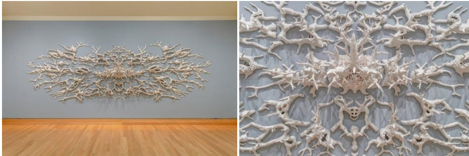
Görsel 13: Courtney Mattison, Kötü İkizler / Malum Geminos, Sırlanmış Taş ve Seramik, 213x 635x55 cm, 2019.

Deniz biyolojisi eğitimi almış ve okyanusların korunması üzerine bilimsel çalışmaları olan sanatçı Courtney Mattison'un çalışmaları ile mercan resiflerinin sera gazı, çevre kirliliği ve aşırı avlanma gibi sebepler nedeni ile tehlike altında olması durumuna dikkat çekmektedir. Sanatçı, üretimleriyle birlikte insanlarda bilimsel verilerin yapamadığı çevre bilincini ve duyarlılığını sağlamayı amaçlamaktadır. Çalışmalarında su altında gözlerden uzak olan mercan resiflerini taklit eden Mattison, mercan resiflerinin güzelliklerini ve iklim değişikliğinin üzerlerindeki etkilerini yüzeye çıkartarak görünür hale getirmektedir. Görsel 13'deki çalışması duvara yerleştirilmiş 213x635x55 cm. boyutlarında oldukça geniş bir alanı kaplamaktadır. Çalışmanın sadeliğini destekleyen yalın bir sergileme aracılığı ile sanatçı sadece çalışmaya dikkat çekmek istemiştir. Sağ ve solda simetrik ayna yansımalarını andıran bir tasarıma sahip olan bu çalışmasında izleyiciyi merkeze odaklanmaya yönlendirmektedir.