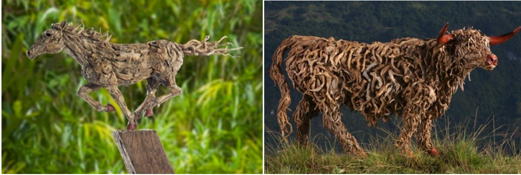
Görsel 9: James Doran Webb, Ateştopu I / Fireball I, Su ile Aşınmış Odun Parçaları ve Çelik, 86 x 22 x 125cm, 19 kg, 2022.

Doğa içerisinde her şey bir döngü içerisinde, James Doran Webb'in çalışmalarında su ile aşınmış odun parçalarını kullanarak izleyiciye doğanın bu döngüdeki yıkıcı etkisini göstermektedir. Üretimlerindeki hayvan figürlerini Görsel 9'daki gibi genelde hareket halinde işleyerek, odun parçalarından oluşmuş olmasına rağmen izleyiciye canlılık hissi vermektedir. Bu canlılık hissini desteklemek için figürünü yaptığı hayvanların kas anatomisine uygun odun parçaları seçmektedir.