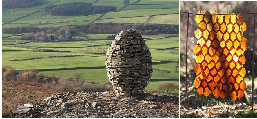
Görsel 3: Richard Shilling, Yumurta / Clougha Egg Cairn, Kumtaşı, 2008.

Richard Shilling, çevre sanatının öncü isimlerinden biridir. Doğadan ve mevsim geçişlerinin doğa üzerindeki etkisinden ilham alan sanatçı aynı zamanda insan ve doğa ilişkisini de sorgulamaktadır. Doğanın içerisinde heykellerini oluştururken çevresindeki taş, dal, yaprak vb. doğal malzemeleri kullanarak çalışmalarının doğaya geri karışmasını sağlamaktadır. Bu nedenle her çalışmasının fotoğrafını çekerek sergilemektedir ancak bazı çalışmaları çok kısa bir süre içerisinde doğaya karıştığı için fotoğrafları dışında görülmesi mümkün olmamaktadır. Tamamen çevreci bir şekilde üretimde bulunan Shilling, insanlara doğaya zarar vermeden de üretim yapılabileceğini göstermektedir. Çalışmalarını doğadan ayıran tek şey kullandığı malzemeleri insan yapımı olduğu belli olacak şekilde gerçekleştirmektedir (Url 3). Shilling, çalışmalarında doğal malzemeye ek olarak geri dönüştürülebilir atık malzemeler de kullanarak ekolojik çevreye destek olmaktadır. Clough Egg Cairn adlı çalışmasını üç günde oluşturmuştur. Bu işinde kullandığı malzeme olan kumtaşlarını yakınlardaki maden ocağı atıklarından toplamıştır. İzleyiciye üretimde bulunmak için sadece tüketmek gerekmediğini, geri dönüştürülebilir atıkları kullanarak da üretim yapılabileceğini göstermektedir.