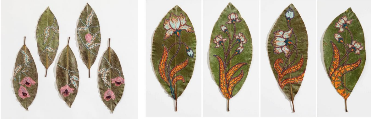
Görsel 15: Hillary Waters Fayle, Daha İyi Günler İçin Açan Çiçek / Blooms for Better Days, Manolya Yaprakları ve İplik, Her Bir Parça İçin 25 x 10cm, 2020.

Hillary Waters Fayle, tekstil geleneklerini kullanarak bu alanın botanik ile kesiştiği alanlarda disiplinler arası üretimlerde bulunmaktadır. Sanatçı kenarları solmuş ve gün geçtikçe kuruyup kırılgan olmaya başlayan yaprakları fabrika üretimi olan yün iplikler ile birleştirerek doğa ve insan arasındaki ilişkiyi güçlendirmektedir. Waters Fayle kuru yapraklara uyguladığı ayrıntılı ve renkli nakışlarla iki malzemenin de hayatta kalmasını sağlamaktadır (Url 14).